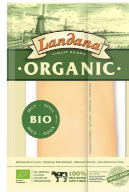
PLAKKEN ORGANIC MILD