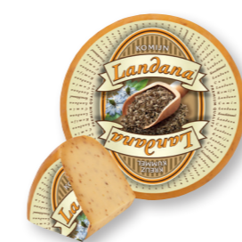
KOMIJN 48+ /circa 4 kg