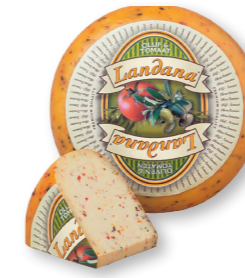
OLIJF & TOMAAT 50+ /circa 4 kg