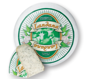
GEIT BRANDNETEL & KNOFLOOK 50+ /circa 4 kg