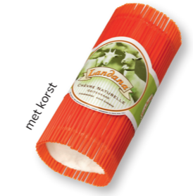
CHÈVRE NATUREL 50+ /circa 1 kg