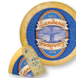
BLAUW 60+ /circa 4 kg