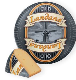
OUD 48+ /circa 10 kg Minimaal 10 maanden gerijpt