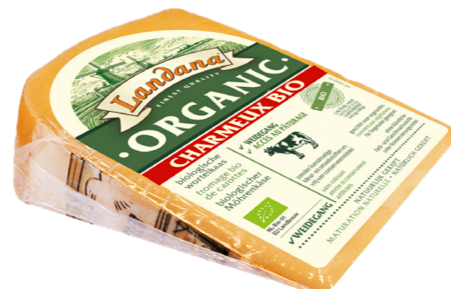
VOORVERPAKT ORGANIC CHARMEUX CHARMEUX