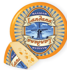
MAASDAM 45+ /circa 12 kg Met gaten