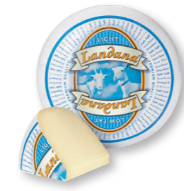
GEIT 35+ 35+ /circa 4 kg Minder vet (17% vet absoluut)