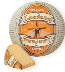
BELEGEN 48+ /circa 12 kg Minimaal 17 weken gerijpt