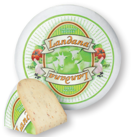
GEIT ITALIAANSE KRUIDEN 50+ /circa 4 kg