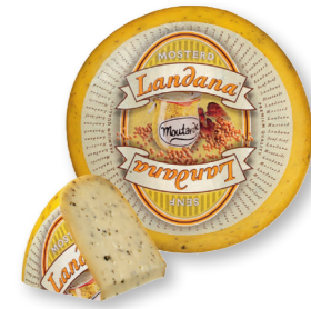
MOSTERD 50+ /circa 4 kg