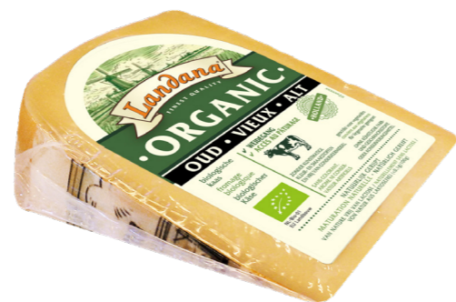
VOORVERPAKT ORGANIC OUD