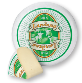
GEIT MILD 50+ /circa 4 kg