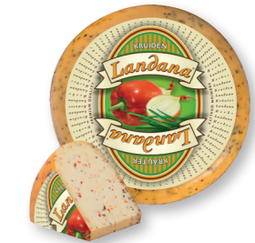
KRUIDEN 50+ /circa 4 kg