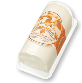
CHÈVRE NATUREL RODE BESSEN 50+ /circa 1 kg blister