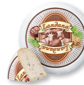
GEIT KORIANDER & FENEGRIEK 50+ /circa 4 kg