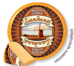
HERFST-GOUDA 48+ /circa 12 kg