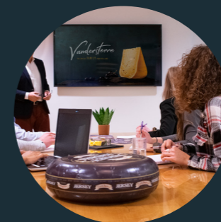
MOTIVERENDE EN GEZONDE WERKOMGEVING