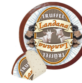
GEIT TRUFFEL 50+ /circa 4 kg