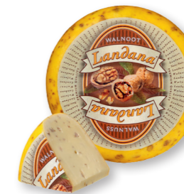
WALNOOT 50+ /circa 4 kg