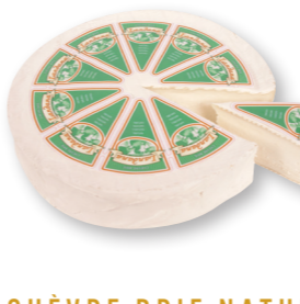
CHÈVRE BRIE NATUREL 100% Hollandse geiten melk 50+ /circa 1,5 kg