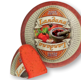
RODE PESTO 50+ /circa 4 kg