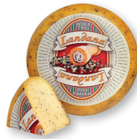
PEPER TRIO 50+ /circa 4 kg