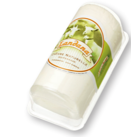
CHÈVRE NATUREL HONING 50+ /circa 1 kg blister