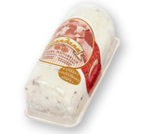
CHÈVRE NATUREL RODE BESSEN 50+ /circa 1 kg blister