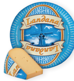
30+ 35+ /circa 12 kg Mindervet (19% vet absoluut)