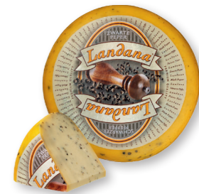
ZWARTE PEPER 50+ /circa 4 kg