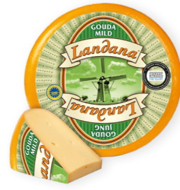
MILD GRAAFSTROOM 48+ /circa 12 kg Minimaal 6 weken gerijpt