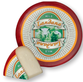
SCHAPENKAAS MILD 50+ /circa 4 kg