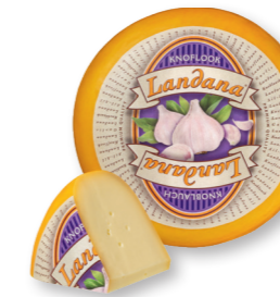
KNOFLOOK 50+ /circa 4 kg