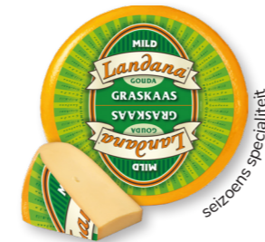
GRASKAAS 48+ /circa 12 kg