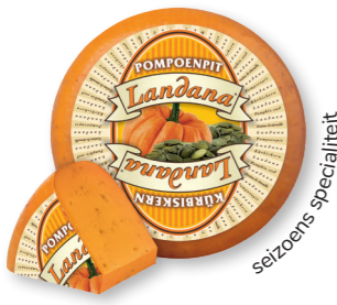
POMPOENPIT 50+ /circa 4 kg