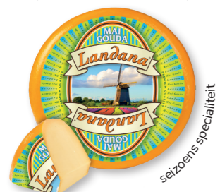
MEI-GOUDA 48+ /circa 12 kg