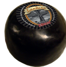
EDAM OUD 40+ /0,9 of 1,7 kg