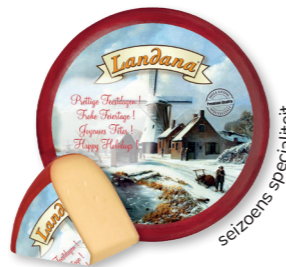
FEESTDAGEN KAAS 50+ /circa 4 kg