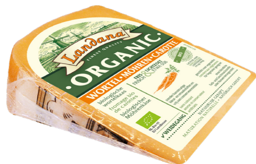
VOORVERPAKT ORGANIC WORTEL

100% Hollandse Demeter koemelk. Op natuurlijke wijze gerijpt voor 12-14 weken. 50+, beschikbaar in wielen (4 kg).