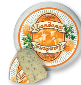
GEIT HONING & TIJM 50+ /circa 4 kg