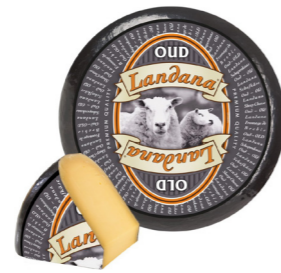
SCHAPENKAAS OUD 50+ /circa 4 kg