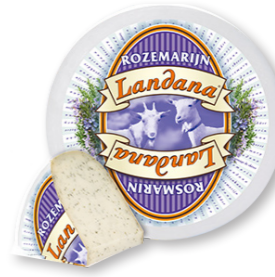
GEIT ROZEMARIJN 50+ /circa 4 kg