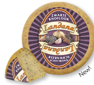
ZWARTE KNOFLOOK 50+ /circa 4 kg