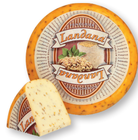
FENEGRIEK 50+ /circa 4 kg