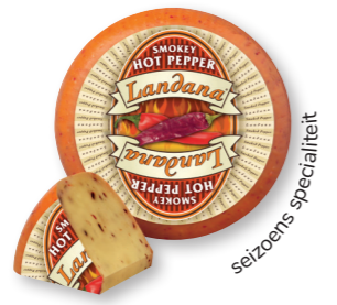
HETE PEPER 50+ /circa 4 kg