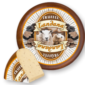
SCHAPENKAAS TRUFFEL 50+ /circa 4 kg