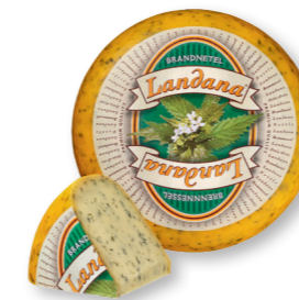
BRANDNETEL 50+ /circa 4 kg