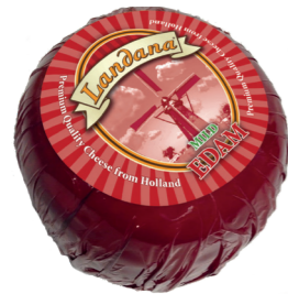
EDAM MILD 40+ /0,9 of 1,7 kg