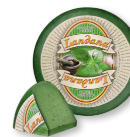
GROENE PESTO 50+ /circa 4 kg