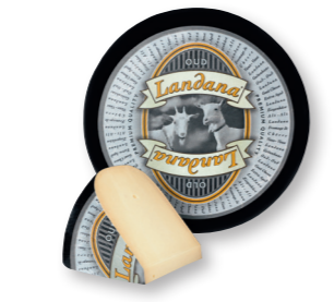
GEIT OUD Minimaal 10 maanden gerijpt 50+ /circa 4 kg