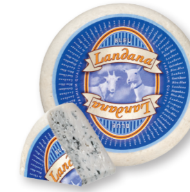
GEIT BLAUW 50+ /circa 4 kg