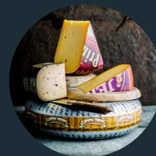
KLIMAATVERANTWOORDE PREMIUM ZUIVEL