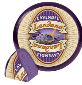
LAVENDEL 50+ /circa 4 kg