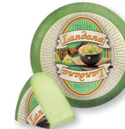
WASABI 50+ /circa 4 kg