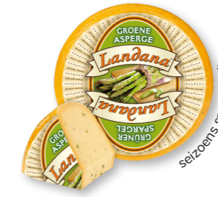
GROENE ASPERGES 50+ /circa 4 kg