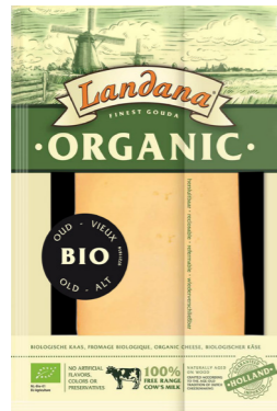
PLAKKEN ORGANIC OUD