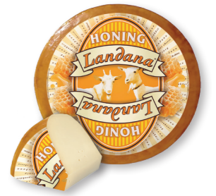
GEIT HONING 50+ /circa 4 kg