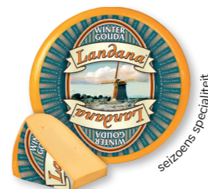
WINTER-GOUDA 48+ /circa 12 kg