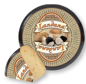
TRUFFEL & PADDENSTOEL 50+ /circa 4 kg