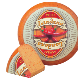
CHILI-SAMBAL 50+ /circa 4 kg