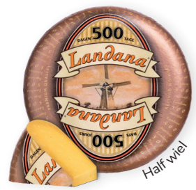
500 DAGEN 48+ /half wiel circa 5 kg Minimaal 500 dagen gerijpt