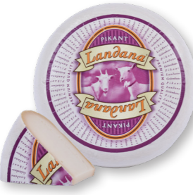
GEIT BELEGEN 50+ /circa 4 kg