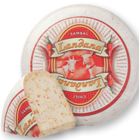
GEIT CHILI SAMBAL 50+ /circa 4 kg