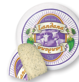
GEIT DASLOOK 50+ /circa 4 kg