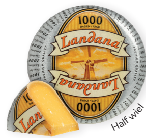
1000 DAGEN 48+ / half wiel circa 5 kg Minimaal 1000 dagen gerijpt