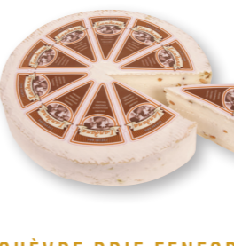
CHÈVRE BRIE FENEGRIEK 100% Hollandse geiten melk 50+ /circa 1,5 kg