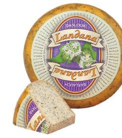
DASLOOK 50+ /circa 4 kg