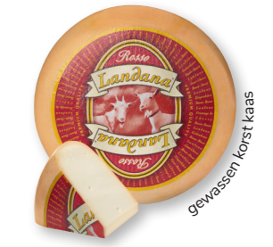
GEIT ROSSO 50+ /circa 4 kg