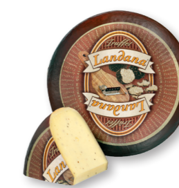
TRUFFEL 50+ /circa 4 kg