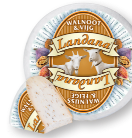
GEIT WALNOOT & VIJG 50+ /circa 4 kg