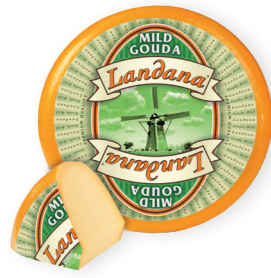
MILD 48+ /circa 4 of 12 kg Minimaal 6 weken gerijpt