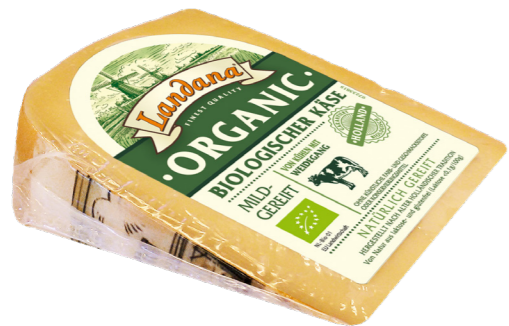
VOORVERPAKT ORGANIC MILD