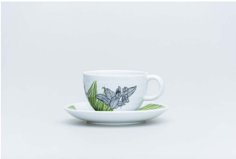
LILI'S TEA MUG AND TEAPOT