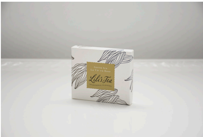
GREEN TEA LA VIE EN ROSE - Biodegradable

English Breakfast with safflower is a vibrant black tea blend and has a full taste.