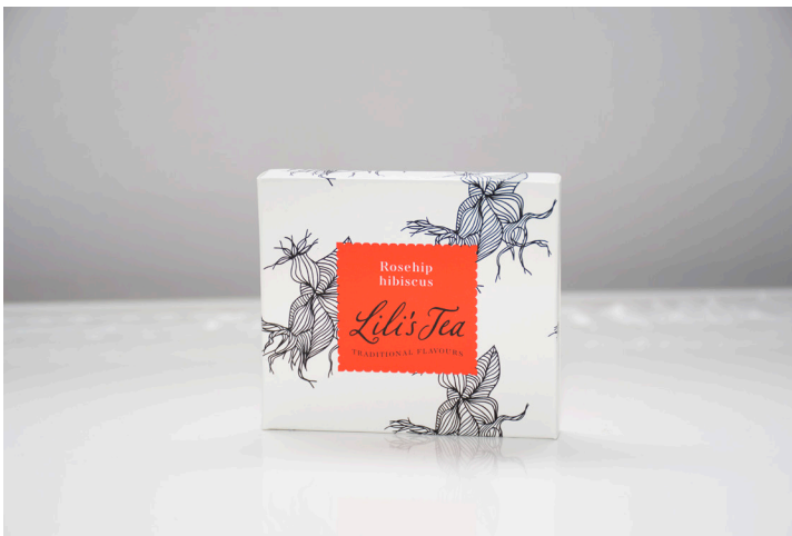
ROSEHIP HIBISCUS - Biodegradable

This green tea is subtly flavored with mint and rose petals. The tea has a freshly and delicate mint flavor.