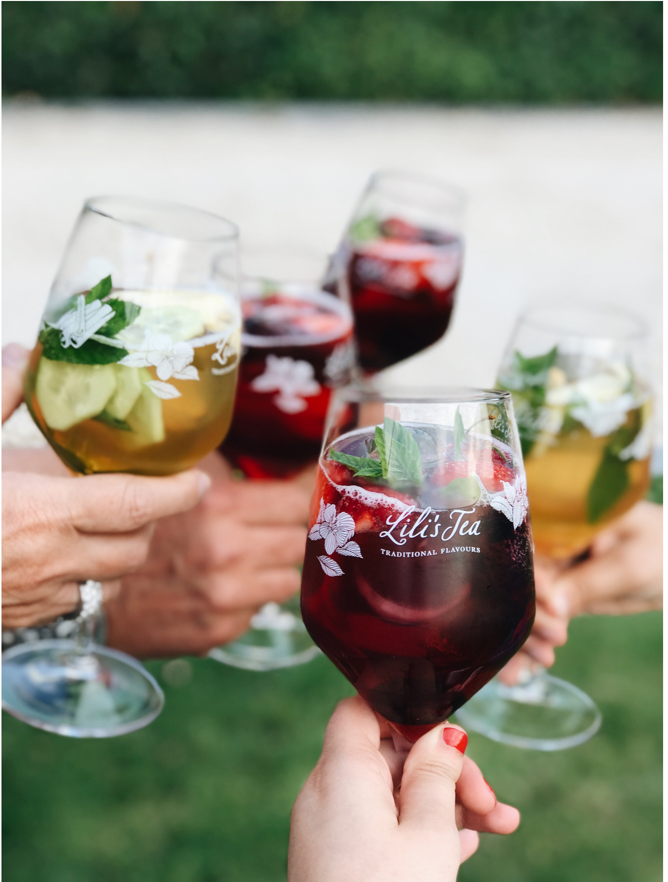
LILI'S TEA Cocktail Glass