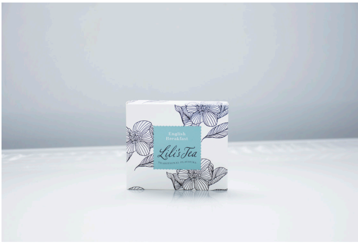
ENGLISH BREAKFAST - Biodegradable

English Breakfast met saffloer blaadjes is een levendige blend en heeft een volle smaak.