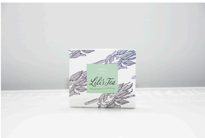
GREEN TEA LEMONGRASS - Biodegradable

This super fresh delicious green tea is a true sensation. Lemongrass and red berries give this green tea a fresh and at the same time fruity taste with a sparkling touch.