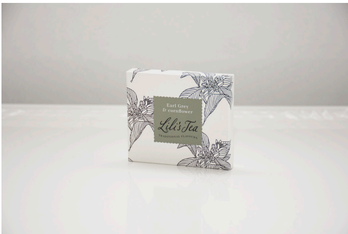
EARL GREY & CORNFLOWER - Biodegradable

Een thee uit Sri Lanka van een zeer hoge kwaliteit. Earl grey thee is zowel licht als verfrissend met een onderscheidende citroensmaak van bergamot. Dit theezakje is biologisch afbreekbaar.