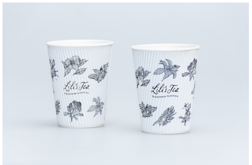
LILI'S TEA TAKE-A-WAY 100% Sugar Cane - rietsuiker