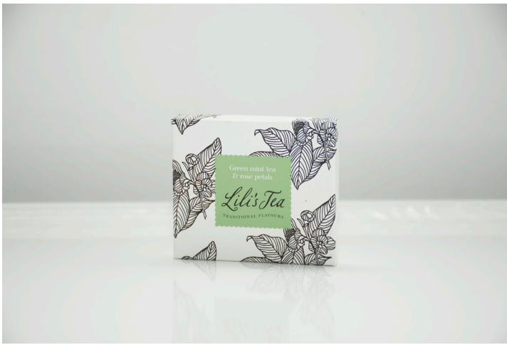
GREEN MINT TEA AND ROSE PETALS - Biodegradable

Deze groene thee is subtiel op smaak gebracht met munt en rozenblaadjes. De thee heeft een friszoete muntsmaak.