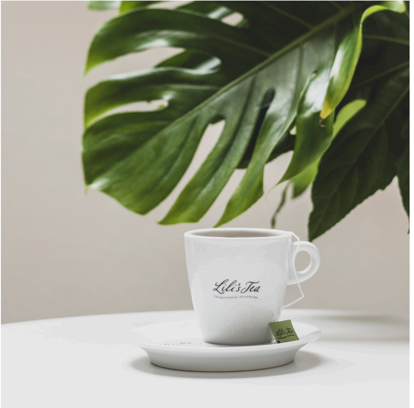
LILI'S TEA WHITE PORCELAIN MUG AND SAUCER