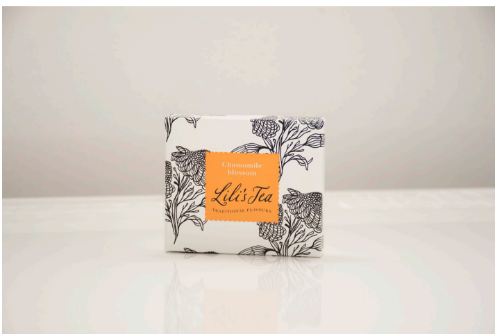
CHAMOMILE BLOSSOM - Biodegradable

A very high quality black tea from Sri Lanka. Earl Grey tea is both light and refreshing with a distinctive lemon flavor of bergamot. This teabag is biodegradable.