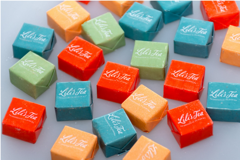
LILI'S TEA sugar cubes