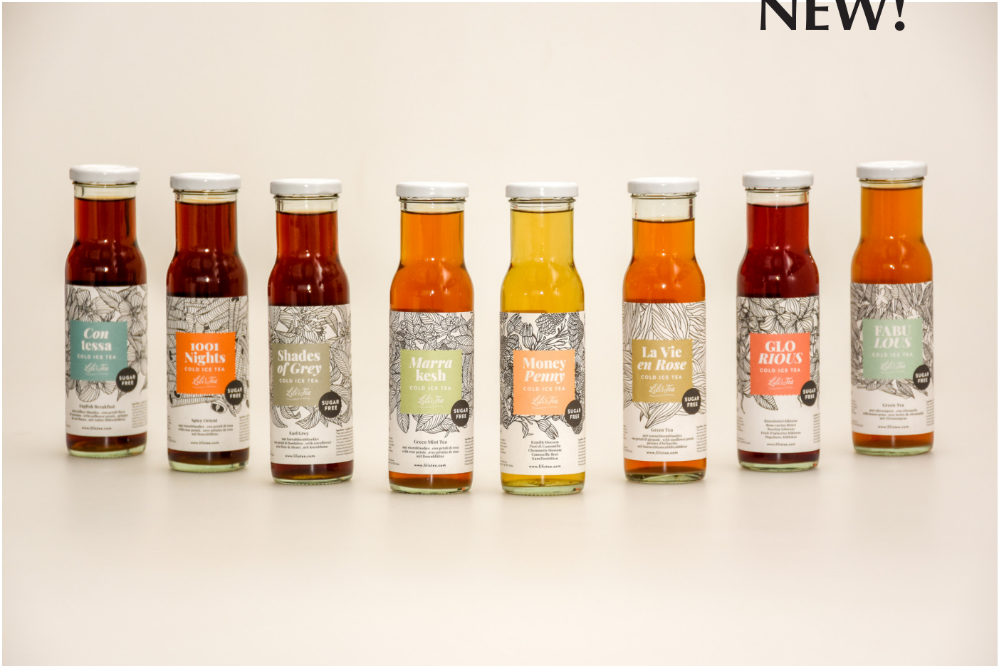
LILI'S TEA COLD ICE TEA - 8 Flavours