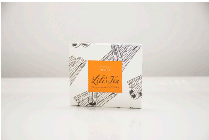
SPICY ORIENT - Biodegradable

A tasty infusion with a fresh and fruity flavor. Rosehip hibiscus infuse is rich in vitamin C, minerals and many antioxidants. This teabag is biodegradable.