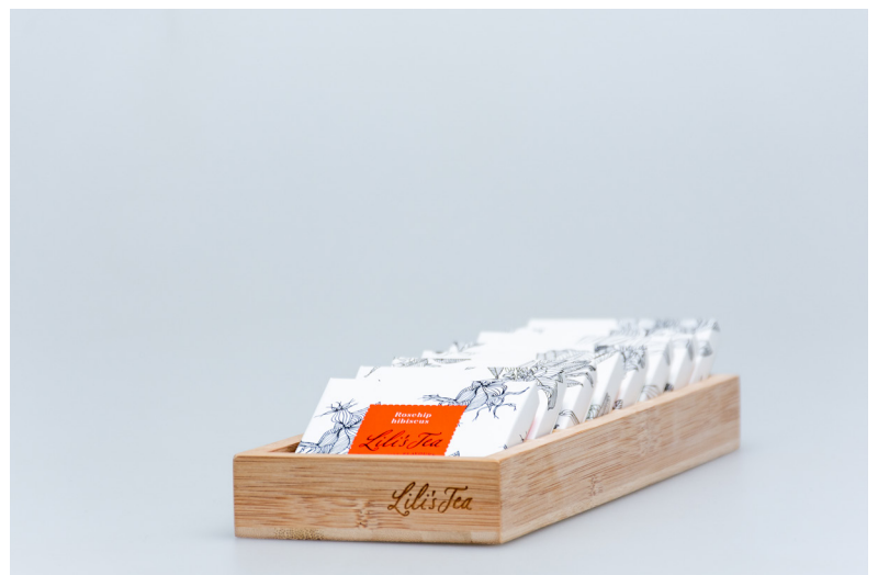
LILI'S TEA DISPENSER