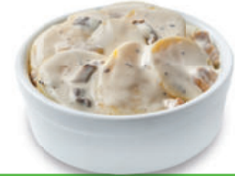
138583 Aardappelgratin met Truffel 2 kg Gratin Dauphinois aux Champignons

Aardappelgratin met truffel en champignons. Luxe aanvulling bij een wild- of feestdagenmenu. Gratin dauphinois à la truffe et aux champignons de Paris. A gratiner au four.