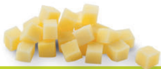
110282 Aardappelblokjes 12 mm 2 kg Cubes de Pommes de Terre 12 mm

Aardappelblokjes, kant en klaar voor in een salade of als bijgerecht op tafel.