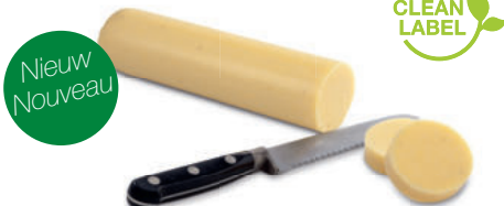
138064 Aardappel Polenta Rolls 2 x 700 gr Rouleaux de Pommes de Terre à la Polenta

Een combinatie van aardappel en polenta (maïsmee) met eindeloos veel mogelijkheden. Une combinaison de pomme de terre et de polenta (farine de maïs) aux possibilités infinies.