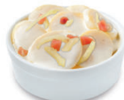
143983 Gratin Raclette 2 kg Raclette Gratin

Een volle Aardappelgratin met Raclette kaas en uitgebakken spekjes. Gratin dauphinois au fromage à Raclette aux lardons.