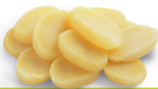
113782 Aardappelschijfjes 10 mm 2 kg Rondelles de Pommes de Terre 10 mm

Voorgedaard aardappelschijfje, klaar voor verdere bereiding of verwerking.