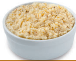
134883 Aardappelpuree 2 kg Purée de Pommes de Terre

Koelverse aardappelpuree, authentiek recept met echte boter, melk en nootmuskaat. Véritable purée fraîche avec du beurre, du lait et à la noix de muscade.