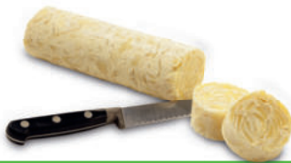
137864 Aardappelgratin Rolls 2 x 700 gr Gratin de Pommes de Terre Rouleaux

Aardappelgratin Roll, een heerlijke aardappelgratin voor een unieke, home-made presentatie. Rouleaux de gratin dauphinois, à découper en parts pour une présentation originale.