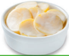
131783 Aardappelgratin 2 kg Gratin Dauphinois

Klassieker met echte room. Alleen even afgratineren met kaas en in de oven te bereiden. Un classique à la crème fraîche. A gratiner au four.