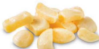
141183 Home Made Potatoes 2 kg Home Made Potatoes

Ambachtelijke aardappelen in grove snit met plantaardige oliën. Voor een snelle bereiding en onderwets lekkere smaak. Pommes de terre prêtes à sauter. Préparation rapide à la poêle ou au four.