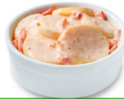
138483 Mediterraanse Gratin Gratin Méditerranéen

Aardappelgratin met paprika en sweetpepperkaas, met een mediterrane tintje. Gratin dauphinois avec du poivron et du fromage au poivron doux. A gratiner au four.