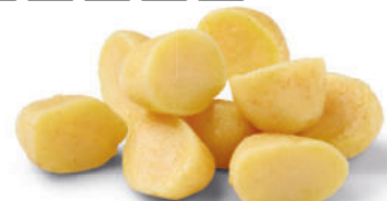
146183 Roasting Potatoes 2 kg Pommes de Terre à Rôtir au Four

Koelverse halve aardappelen met raapzaadolie, om in de oven te roosteren. Demi-pommes de terre enrobées d'huile de colza, à rôtir au four.