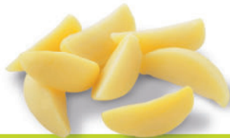
112082 Aardappelpartjes 2 kg Quartiers de Pommes de Terre

Aardappelpartjes, om te bakken, ideaal bijgerecht op tafel.