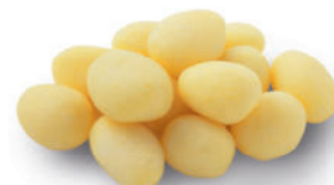
117382 Kriel 2 kg Les Grenailles

Natuurlijke kriel, ideaal als bijgerecht bij asperges.