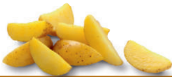
134082 Aardappelwedges met Olie 2 kg Wedges à Rôtir

Aardappelpartjes met schil in olie. Direct uit de verpakking te bakken in koekenpan of oven. Quartiers de pommes de terre avec leur peau, enrobées d'une huile végétale. A cuire directement sortis de l'emballage, à la poêle, au four ou à la rôtissoire.