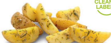
138783 Aardappelwedges met Rozemarijn 2 kg Wedges à Rôtir au Romarin

Aardappelpartjes in de schil met rozemarijn, door garing in de rozemarijnolie is de smaak volledig door de aardappelen opgenomen. Quartiers de pommes de terre dans une huile aromatisée au romarin. A cuire directement sortis de l'emballage, à la poêle, au four ou à la rôtissoire.