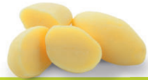
112682 Kookaardappelen 2 kg Les Vapeurs Coupées

Gehalveerde kookaardappel, in een ambachtelijke snit.