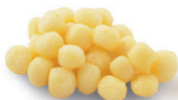
117082 Mini Kriel 2 kg Les Mini Grenailles

Geprofileerde minikriel, het kleinste formaat kriel in de range.