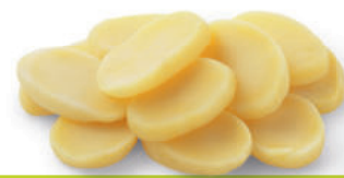
114982 Aardappelschijfjes 8 mm (los verpakt) | Rondelles de Pommes de Terre 8 mm (non sous vide)

Losverpakte schijven, snel te bakken in de koekenpan of frituur.