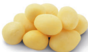
117582 Fijne Piepers 2 kg Les Parisiennes

Kleine kookaardappel, in slechts enkele minuten te bereiden.