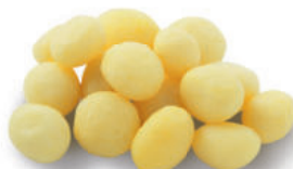
117282 Fijne Kriel 2 kg Les Petites Grenailles

Natuurlijk krietje, heerlijk als het gekookt of gebakken is.