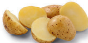
138282 Halve Aardappelen in Schil 2 kg Demi-Lune à Rôtir

Halve aardappelen met schil, verpakt met een beetje olie, zout en peper. Demi-pommes de terre avec leur peau, enrobées d'une huile végétale. A cuire directement sortis de l'emballage, à la poêle, au four ou à la rôtissoire.