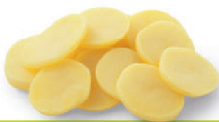
113282 Aardappelschijfjes 6 mm 2 kg Rondelles de Pommes de Terre 6 mm

Heerlijk voorgedaard aardappelschijfje om te verwerken in een ovenschotel.