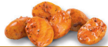
134983 Mexicaanse Aardappelen 2 kg Pommes de Terre Mexicaines

Gehalveerde aardappelen met schil in een rijke, kruidige olie met krachtige smaak. Demi-pommes de terre avec leur peau, enrobées d'une huile aromatisée aux herbes. A cuire directement sortis de l'emballage, à la poêle, au four ou à la rôtissoire.