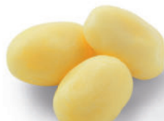
117682 Piepers 2 kg Les Vapeurs

Grote hele kookaardappel, ouderwets lekker bijgerecht op tafel.