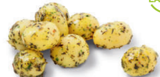
138682 Provençaalse Krieltjes 2 kg Pommes de Terre à la Provençale

Krieltjes gegaard in een olie met authentieke Provençaalse kruiden voor een heerlijke smaak. Lekker uit de oven. Grenailles cuites dans une huile aromatisée aux véritables herbes de Provence. A cuire directement sortis de l'emballage, à la poêle, au four ou à la rôtissoire.